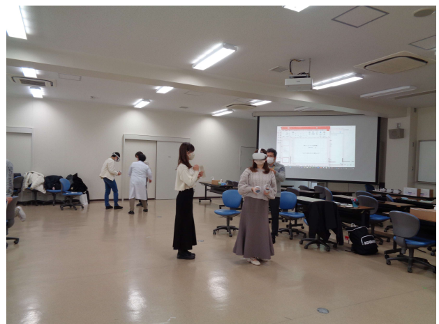
VR (Virtual Reality) 実習風景